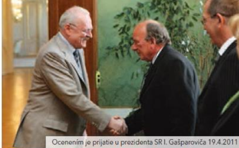
Ocenením je prijatie u prezidenta SR I. Gašparoviča 19.4.2011