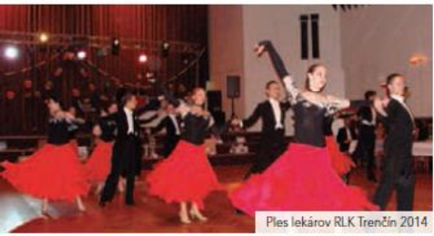
Ples lekárov RLK Trenčín 2014