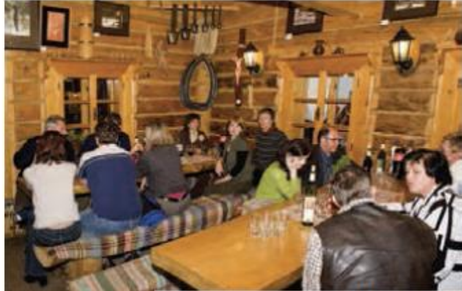
Vyhodnotenie výsledkov LEKOMSKI a večerný raut