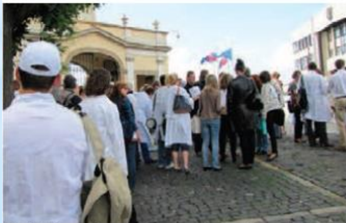
Pred NR SR sme podporovali naše sestry - obaja nezabúdajme, že sme jeden