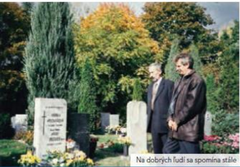
Na dobrých ľuďoch sa spomína stále