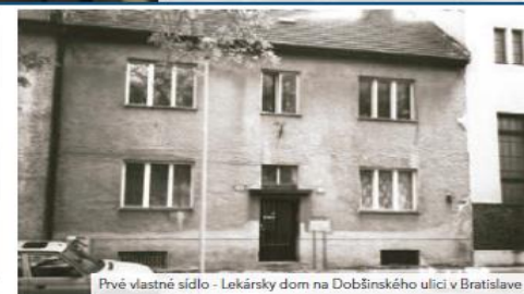
Prvé vlastné sídlo - Lekársky dom na Dobšinského ulici v Bratislave