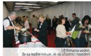
Už Rimania vedeli, že sa lepšie rokuje, ak sú účastníci najedení