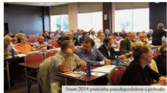
Snem 2014 prebieha pravdepodobne v pohode