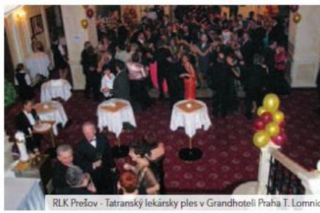
RLK Prešov - Tatranský lekársky ples v Grandhoteli Praha T. Lomnic