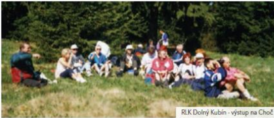
RLK Dolný Kubín - výstup na Choč