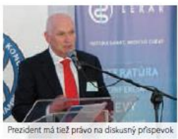
Prezident má tiež právo na diskusný príspevok