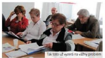
Tak toto už vyzerá na vážny problém