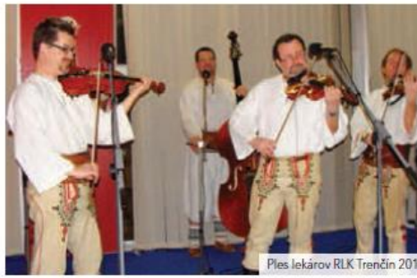
Ples lekárov RLK Trenčín 201