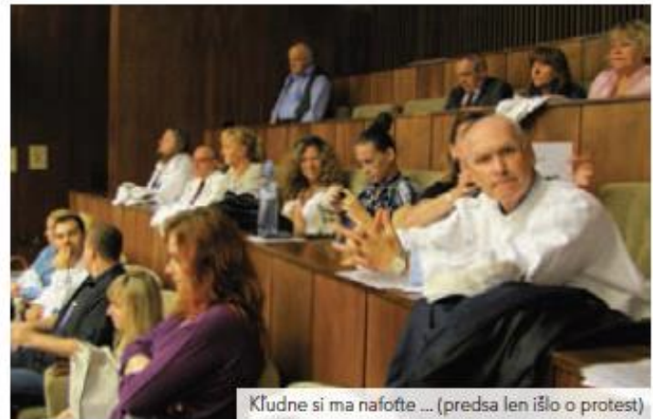
Kľudne si ma nafotíte ... (predsa len išlo o protest)