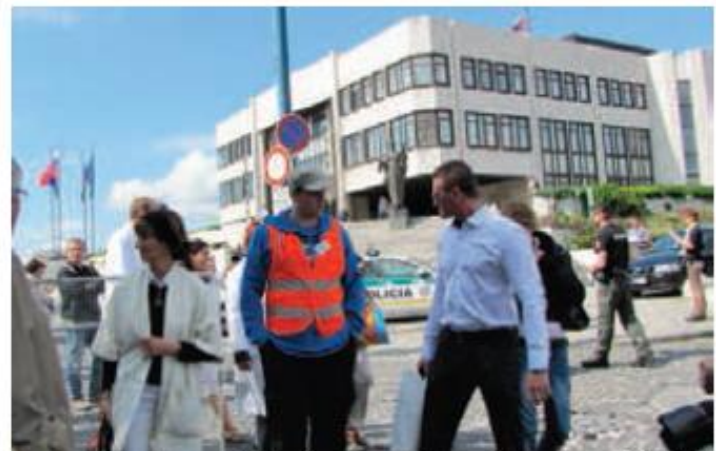
Za práva zdravotníkov - snáď nie výzva na férovku?