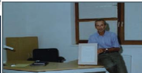
Tak toto sa nám podarilo - Lekársky dom je hotový a náš