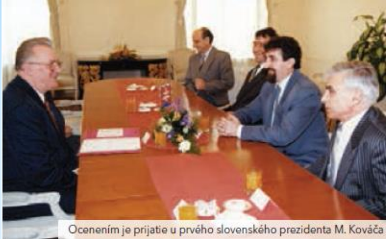
Ocenením je prijatie u prvého slovenského prezidenta M. Kováča