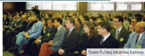
Snem Poľskej lekárskej komory