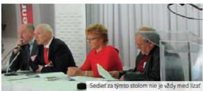
Sedia za týmto stolom nie je vždy med lízaf