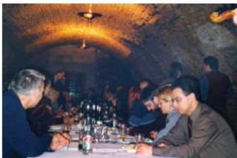
Toto nazývame rokovanim v správnej atmosfére