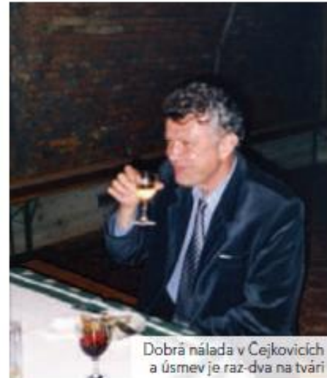
Dobrá nálada v Cejkovicích a úsmev je raz-dva na tvári