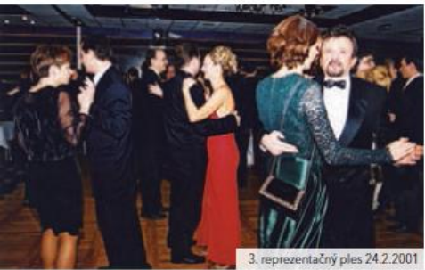
3. reprezentačný ples 24.2.2001