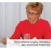
Nepoznámé krajšiu literatúru ako snemové materiály