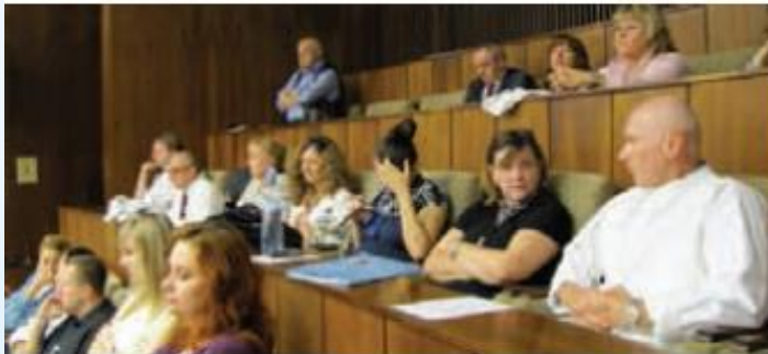
Na snemy sa chodilo dokonca priamo z pracoviska (alebo sa chystá protest?)