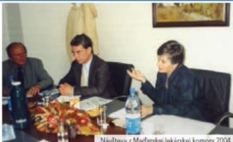
Návšteva z Maďarskej lekárskej komory 2004