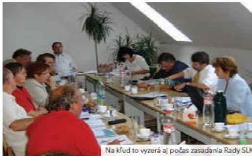
Na kľud to vyzerá aj počas zasadania Rady SLK