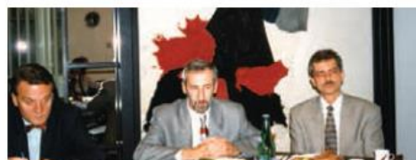
Návšteva CLK v Olomouci v roku 1997 - podpísanie zmluvy o spolupráci