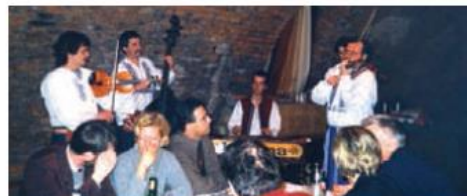
Stretnutie s priateľmi z Českej lekárskej komory v Cejkovicih