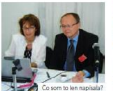
Co som to len napísala?