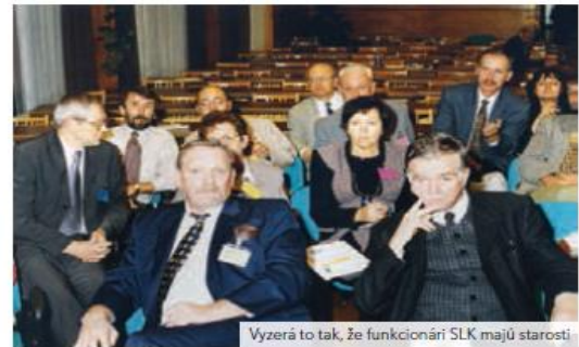
Vyzerá to tak, že funkcionári SLK majú starosť