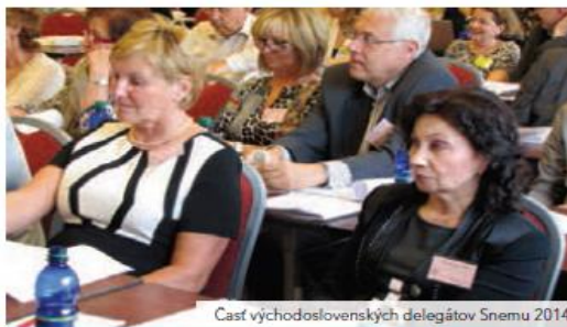
Čas východoslovenských delegátov Snemu 2014