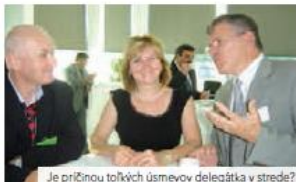
Je príčinou toľkých úsmevov delegátka v strede?