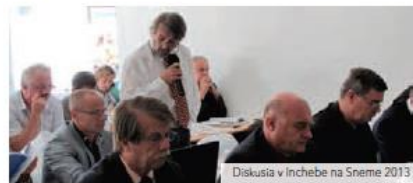
Diskusia v Inchebe na Sneme 2013