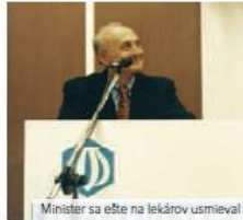
Minister sa ešte na lekárov usmieval