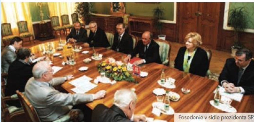
Posedenie v sídle prezidenta SR