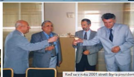
Keď sa v roku 2001 stretli štyria prezidenti