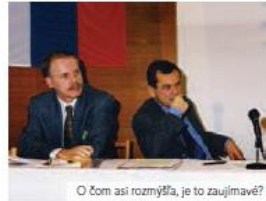
O čom asi rozmyšľa, je to zaujímavé?