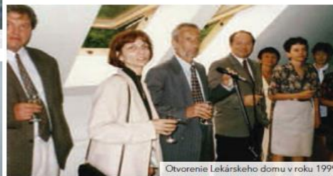
Otvorenie Lekárskeho domu v roku 1999