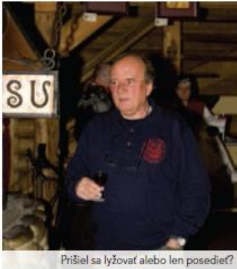
Prišiel sa lyžovať alebo len posedieť?