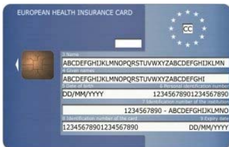
Príklad prednej strany