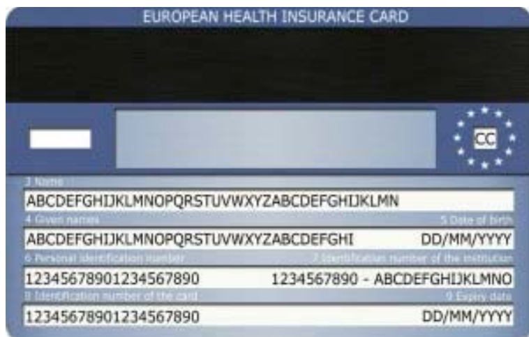
Príklad zadnej strany